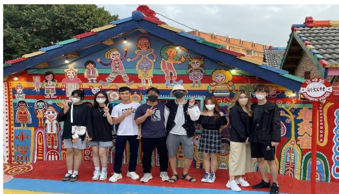
Tham quan làng Cầu Vòng

Mặc dù là trường có mức học phí hơi cao thuộc hàng đầu Đài Loan nhưng so sánh với các nước có nền giáo dục phát triển trong khu vực thì đây vẫn là một ưu thế vượt trội với chất lượng giáo dục tốt. Phòng học được trang bị đầy đủ các thiết bị hiện đại như máy chiếu, camera, bảng cảm ứng, máy tính ... nhằm phục vụ tốt nhất cho công tác giảng dạy và học hỏi. Thư viện có hàng triệu đầu sách đủ mọi thể loại cho sinh viên nghiên cứu. Tài liệu nơi đây cũng rất phong phú và đa dạng, số lượng sách và tạp chí mà nhà trường mua bản quyền rất nhiều nên hầu như các sinh viên không hề gặp khó khăn trong việc tìm kiếm tài liệu chuyên ngành. Rất nhiều giảng viên của trường đều tốt nghiệp tại Mỹ, có trình độ và chuyên môn cao, đặc biệt rất thân thiện quan tâm tới sinh viên nước ngoài như chúng tôi. Tại đây tôi còn có cơ hội được trò chuyện ăn cơm với giáo viên, điều này thật sự rất hiếm khi ở Việt Nam.