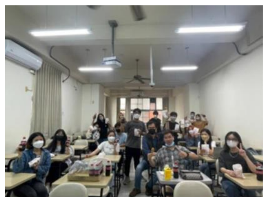
Sự thoải mái, vui vẻ giữa thầy và trò sau mỗi buổi học