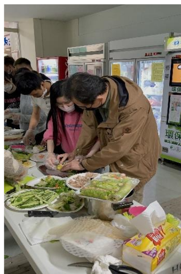
Thầy chủ nhiệm cùng lớp mình làm món Việt

Trường có chính sách hợp tác với các tập đoàn, công ty. Thông qua mối quan hệ