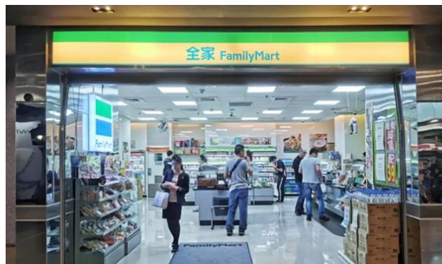
Một trong số cửa hàng tiện lợi cả ngày đều bận rộn