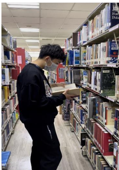
Chúng mình đi thư viện tìm sách

Mặc dù là trường có mức học phí hơi cao thuộc hàng đầu Đài Loan nhưng so sánh với các nước có nền giáo dục phát triển trong khu vực thì đây vẫn là một ưu thế vượt trội với chất lượng giáo dục tốt. Phòng học được trang bị đầy đủ các thiết bị hiện đại như máy chiếu, camera, bảng cảm ứng, máy tính ... nhằm phục vụ tốt nhất cho công tác giảng dạy và học hỏi. Thư viện có hàng triệu đầu sách đủ mọi thể loại cho sinh viên nghiên cứu. Tài liệu nơi đây cũng rất phong phú và đa dạng, số lượng sách và tạp chí mà nhà trường mua bản quyền rất nhiều nên hầu như các sinh viên không hề gặp khó khăn trong việc tìm kiếm tài liệu chuyên ngành. Rất nhiều giảng viên của trường đều tốt nghiệp tại Mỹ, có trình độ và chuyên môn cao, đặc biệt rất thân thiện quan tâm tới sinh viên nước ngoài như chúng tôi. Tại đây tôi còn có cơ hội được trò chuyện ăn cơm với giáo viên, điều này thật sự rất hiếm khi ở Việt Nam.