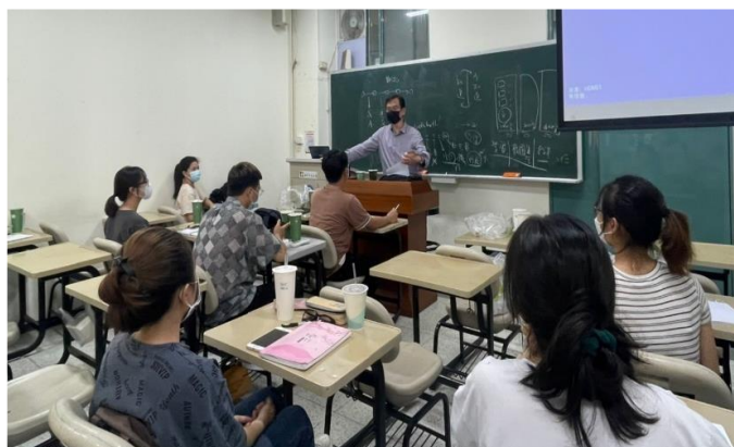
Mỗi tiết lên lớp thầy đem đến rất nhiều kiến thức mới lạ

Việc tiếp thu kiến thức vốn dĩ là rất khó khăn, khi ban đầu tiếng Trung của chúng mình còn rất kém. Rất may nhờ sự nhiệt tình, giúp đỡ hết mình của các anh chị trợ giảng nên chúng mình nắm bắt kiến thức một cách rõ ràng, đầy đủ. Qua đó cũng quen dần hơn với môi trường học tập tại nơi đây.