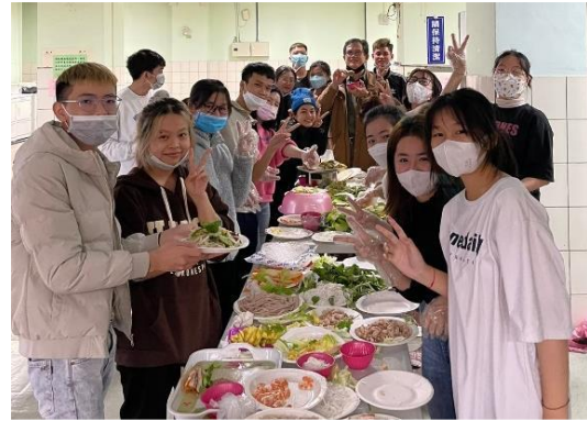
Hoạt động: Giao lưu ẩm thực Việt Nam

Bên cạnh học các môn chuyên ngành, việc học tiếng Trung và giáo dục thể chất cũng là bắt buộc. Để mà nói, lúc mới bắt đầu làm quen với tiếng Trung thực sự rất nản bởi vì nó hoàn toàn khác so với tiếng Việt. Các thầy cô giáo dạy tiếng Trung của lớp mình đa phần đều rất trẻ, điều đó giúp thầy cô nắm bắt được những khó khăn của học sinh, giúp cho học sinh biết nên bắt đầu từ đâu, làm cách nào để học được tiếng Trung một cách nhanh nhất. Ngoài việc giới thiệu chữ cứng, nghĩa, cách dùng của nó, thầy cô còn tìm những hình ảnh, video để học sinh có thể hiểu và ghi nhớ. Sử dụng trò chơi để kiểm tra đầu giờ thay việc cho học sinh nhắc lại nội dung đã học một cách nhàm chán, điều này đã giúp cho học sinh linh hoạt hơn trong việc sử dụng tiếng Trung. Các tiết học thể chất thì đa dạng hóa các bộ môn như: chạy bộ, bóng rổ, bóng chuyền, cầu lông, bóng bàn, ... Trong trường được xây dựng một phòng tập thể hình, bên trong có đầy đủ các trang thiết bị, dụng cụ thể hình dành cho các bạn sinh viên có nhu cầu đến đây luyện tập.