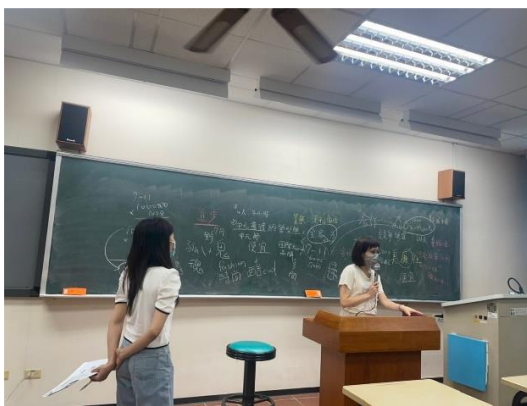
Hai chị phiên dịch đáng yêu của lớp mình