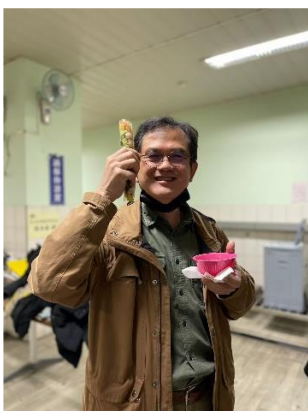
Đây là thầy chủ nhiệm lớp mình

Sau gần một năm học tập tại Triều Dương, người mà mình muốn gửi lời cảm ơn, những tình cảm chân thành nhất đến chính là thầy chủ nhiệm. Trên lớp, thầy là một người vô cùng nghiêm khắc, thầy luôn đảm bảo tất cả các bạn trong lớp hiểu hết bài học của hôm nay mới cho tan học, có báo cáo cuối kì vừa để tổng kết được mỗi học sinh đã học được những gì trong suốt cả học kì, vừa giúp cho học sinh có thể cải thiện được năng lực tiếng Trung, khả năng thuyết trình trước đám đông. Tuy nhiên, lúc kết thúc bài giảng thầy lại như một người cha, người bạn. Mỗi khi học sinh có thắc mắc hay khó khăn gì, thầy luôn là người đầu tiên đứng ra giải đáp, giúp đỡ. Chính những hành động đó đem đến sự ấm áp, yêu thương như một gia đình cho du học sinh .