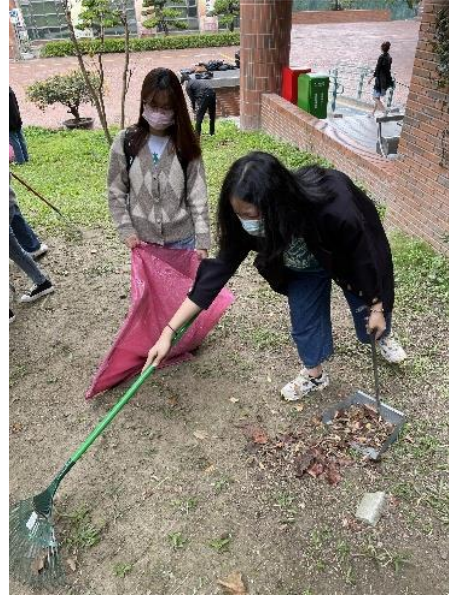
Công việc lao động cũng rất đơn giản

Tôi tin rằng lựa chọn trường Triều Dương, lựa chọn Đài Loan để học tập và làm việc trong ít nhất bốn năm tới là một quyết định không bao giờ sai đối với tôi.