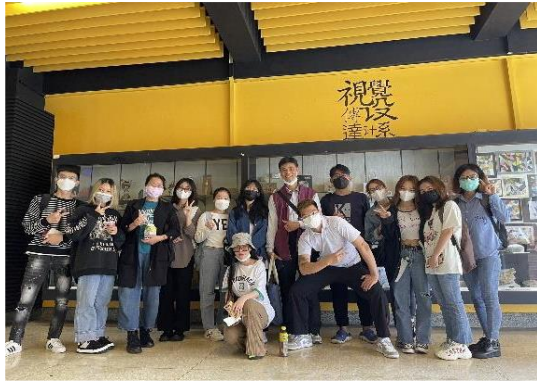
Tham quan và chụp ảnh cùng thầy