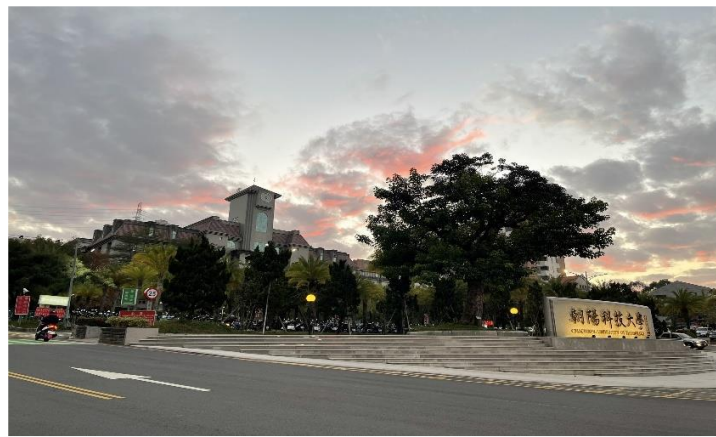
Một góc nhìn từ đường lên trường

Về giáo dục Đài Loan là một trong những khu vực có nền giáo dục phát triển thuộc top đầu trên thế giới. Thế mạnh của giáo dục đại học Đài Loan tập trung vào một số ngành công nghệ, kỹ thuật. Nổi bật trong số đó chính là Trường khoa học và công nghệ Triều Dương cũng là trường mà tôi đang theo học.