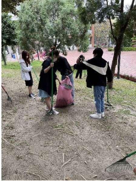
Cả lớp tham gia lao động vệ sinh