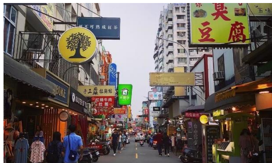
Lối đi vào chợ đêm Yizhong rất sạch sẽ

không mất quá lâu để tôi có thể thích nghi được . Nhắc đến ẩm thực Đài Loan không thể bỏ qua đặc sản “chợ đêm”. Chợ đêm được xem là một trong những biểu tượng của Đài Loan. Tại đây, có rất nhiều món ăn làm nên thương hiệu ẩm thực Đài Loan. Một số món tiêu biểu như: bánh cơm tiết, bánh tro, nhục viên,...đặc biệt phải kể đến món đậu phụ thối. Tên là như vậy nhưng nó không thối và khó ăn như mình nghĩ, ngược lại mình cảm thấy nó khá là ngon. Đồ ăn phong phú và đa dạng như vậy, vậy còn đồ uống ở Đài Loan thì sao? Đài Loan được biết đến là cái nôi của trà sữa thức uống được giới trẻ vô cùng yêu thích. Trà sữa ở Đài Loan có một số hương vị đặc trưng và giá thành cũng rất hợp lý.