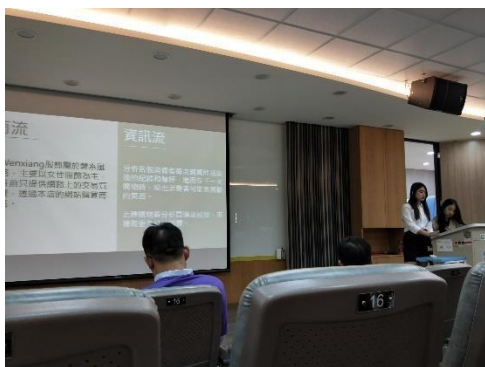
學生說明資訊流如何運用