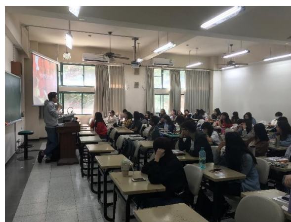
說明資訊流的好處與發展