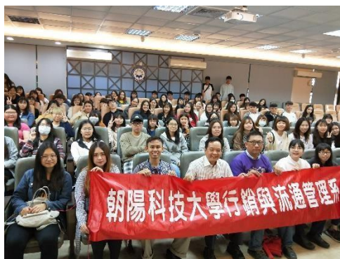
評審與參賽者合照