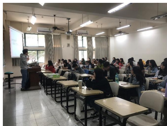
說明企業商流的改善與演進