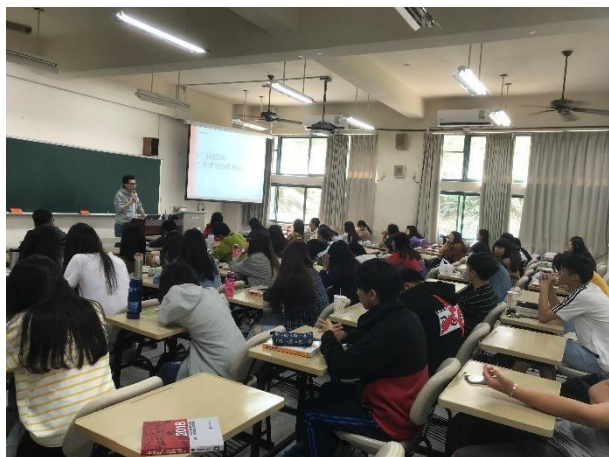
企二代返鄉承接老舊企業轉型前後的差異