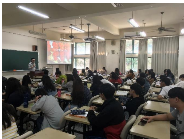
說明物流與金流如何有效管理