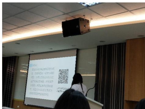
學生說明資訊流實作的價值