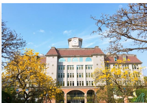
Toà Nhà Hành Chính Của Trường