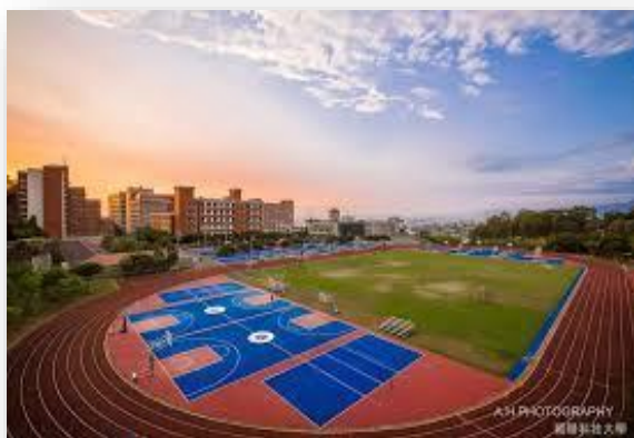
Sân Vận Động Của Trường