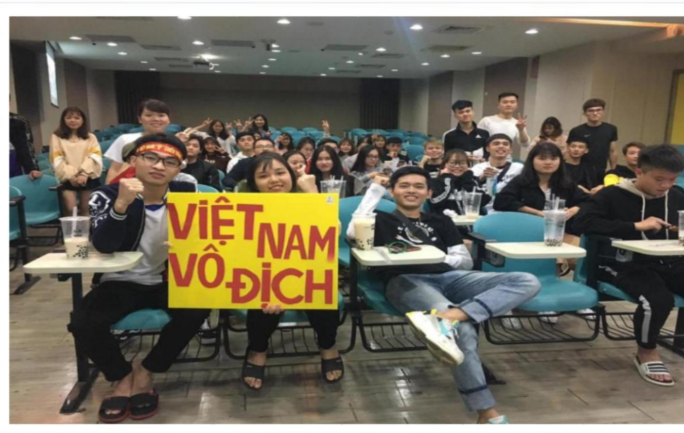
Những khi trực tiếp bóng đá