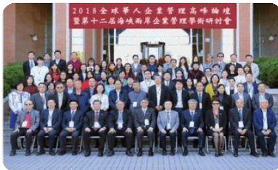
Cán Bộ Cấp Cao Và Các Thầy Cô