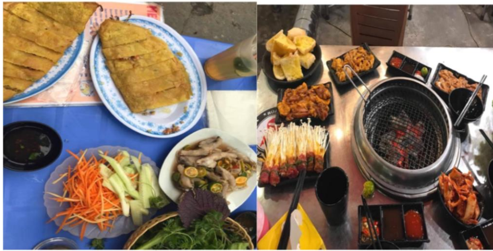
Và còn cả những ngày lễ hội!