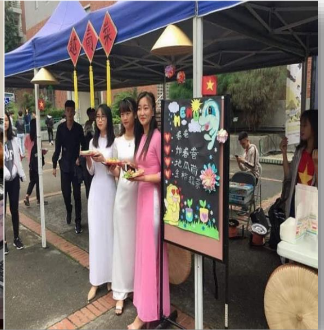
Và còn cả học đi đôi với thực hành!