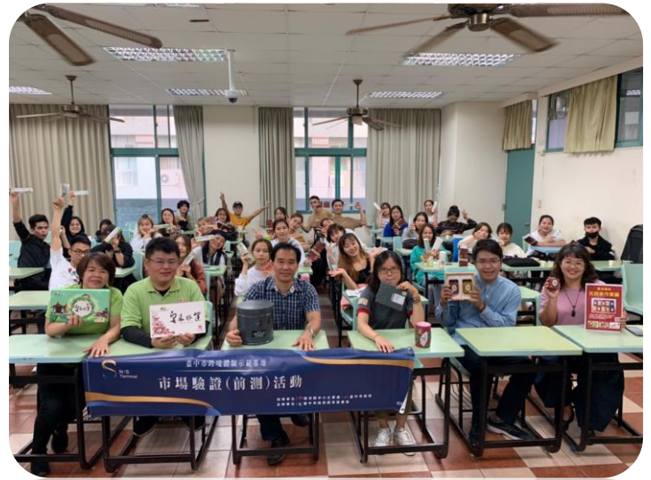
Còn những giờ lên lớp vui vẻ nữa