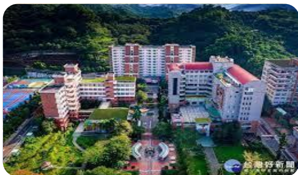
Khuôn Viên Đại Học Triều Dương

Du học là ước mơ của không ít các bạn trẻ và mình cũng vậy, chính vì khát khao muốn vươn cao vươn xa tới các cường quốc năm châu khác, đây mới lạ. Và đây cũng như là một thử thách để chúng ta có thể rời xa khỏi vòng tay bảo vệ của cha mẹ, thử thách bản thân để có thể đến với những cách học tập mới, khuôn khổ mới, cũng như là có thể trao dồi kinh nghiệm trong cuộc sống. Còn lí do tại sao mình lại chọn Đài Loan là điểm đến du học, chắc hẳn bạn cũng biết Đài Loan là một đất nước phát triển có nền giáo dục tốt, an ninh an toàn và học phí không phải quá đắt đỏ, yêu cầu về ngôn ngữ cũng không quá cao như các quốc gia khác. Vì vậy mình đã chọn Đài Loan là nơi để học tập, sinh sống và làm việc. Và ngôi trường mình đã chọn để học tập mang tên là trường ĐẠI HỌC KHOA HỌC CÔNG NGHỆ KỸ THUẬT TRIỀU DƯƠNG và mình học khoa MARKETING AND LOGISTICS. Và hôm nay mình sẽ giới thiệu cho các bạn hiểu hơn về du học sinh tại Đài Loan cũng như môi trường mình đang theo học. Đây là trường mình nè!